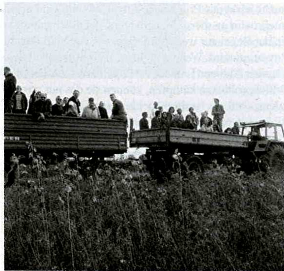
Werte und damit nachhaltige Preise lassen sich nur durch bewusste Wahrnehmung vermitteln.

Auch hinsichtlich der Preisfrage hebt Steiner immer wieder die Notwendigkeit hervor, solche Assoziationen zu bilden. Dies trifft natürlich auch für die Landwirtschaft und das Ernährungsgewerbe zu. Demnach müssten sich die verantwortlichen Menschen der unterschiedlichen Stufen der gesamten Wertschöpfungskette treffen, um mit Gemeinsinn für das Ganze die annähernd richtigen Urteile zu treffen: „Es gibt keine andere Möglichkeit, als das wirtschaftliche Urteil nicht zu bauen auf Theorie, sondern es zu bauen auf die lebendige Assoziation, wo die empfindenden Urteile der Menschen nun real wirksam sind, wo aus der Assoziation heraus fixiert werden kann aus den unmittelbaren Erfahrungen, wie der Wert von irgend etwas sein kann.“ (S. 150)